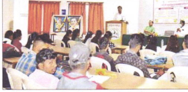
फुलंब्री : संत सावतामाळी महाविद्यालयात कार्यशाळेत बोलताना मान्यवर.