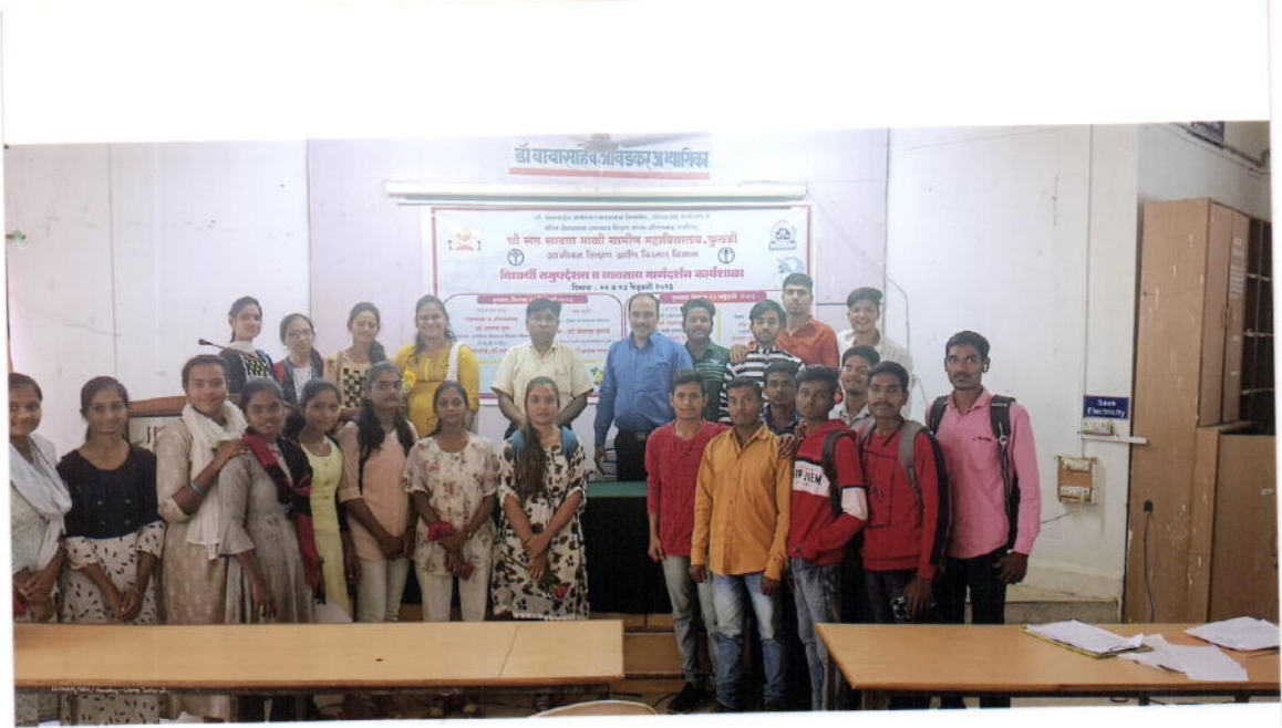
कार्यशाळेच्या समारोप सत्रास उपस्थित विद्यार्थ्यांचा ग्रुप फोटो.